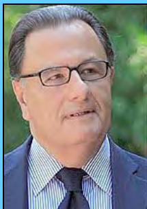
Ο υπουργός Πολιτισμού κ. Πάνος Παναγιωτόπουλος