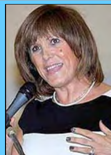
Η γενική γραμματέας Αθλητισμού κα Κυριακή Γιαννακίδου

Καταγγέλλω την Γενική Γραμματεία Αθλητισμού 1) επεικώς για εγκληματική αδιαφορία όσον αφορά στα τεκταινόμενα στην ομοσπονδία του καράτε ΕΛΟΚ, και 2) αυστηρώς για την διαιώνιση του χαρακτηριστικού της Νέας Δημοκρατίας «Συνδρόμου του Γερόλυμπου», που έχει γίνει πλέον «Σήμα Κατατεθέν» της τελευταίας!