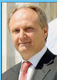
Ο υφυπουργός Αθλητισμού κ. Γιάννης Ανδριανός