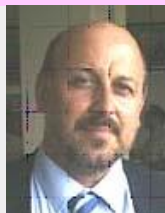
Κώστας Παπαναστασίου Γενικός Γραμματέας ΚΟΕ