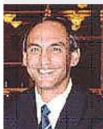
Γιώργος Γερόλυμπος Γενικός Γραμματέας Παγκόσμιας Ομοσπονδίας Καράτε