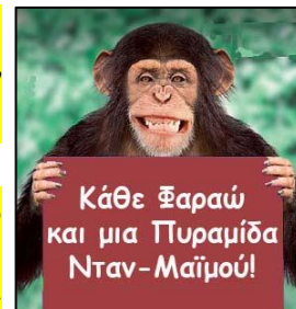
Κάθε Φαραώ και μια Πυραμίδα Νταν-Μαϊμού!

Υπενθυμίζω σε αυτό το σημείο και πάλι ότι ούτε η ΕΛΟΚ ούτε η ΠΕΦΣΚ δεν δημοσίευσαν ποτέ οποιονδήποτε κατάλογο-Μητρώο των Νταν, που έχουν δώσει, πράγμα που αποδεικνύει ότι εισέπρατταν μαύρο χρήμα από τις πωλήσεις των Νταν!!!