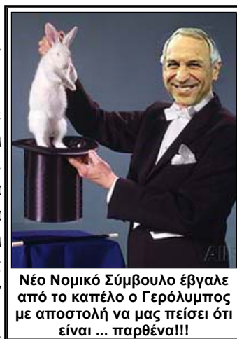
Νέο Νομικό Σύμβουλο έβγαλε από το καπέλο ο Γερόλυμπος με αποστολή να μας πείσει ότι είναι ... παρθένα!!!