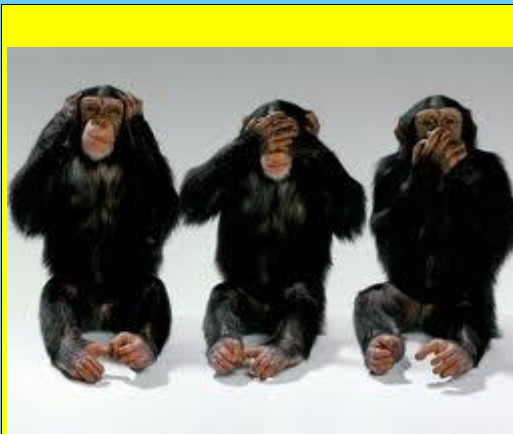
Η ΓΓΑ δεν ακούει, δεν βλέπει, δεν μιλάει! Τότε τι κάνει???