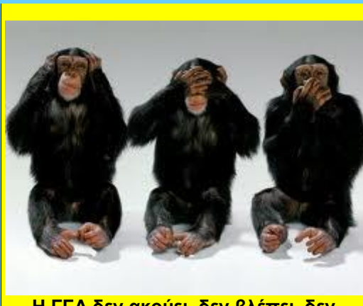
Η ΓΓΑ δεν ακούει, δεν βλέπει, δεν μιλάει! Τότε τι κάνει???