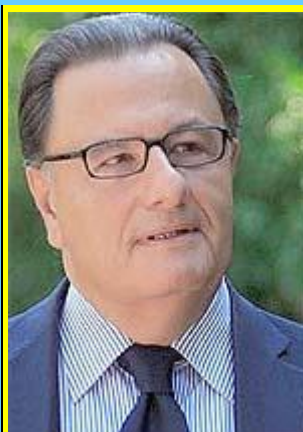
Ο υπουργός Πολιτισμού κ. Πάνος Παναγιωτόπουλος

Με τα προηγούμενα άρθρα μου έχω ήδη αποδείξει ότι οι ανωτέρω είναι "προκλητικοί επιχειρηματίες" που εκμεταλλεύονται την Ελληνική Ομοσπονδία Καράτε από τις θέσεις τους στο διοικητικό της συμβούλιο και ... παραπλεύρως, παραβιάζοντας ταυτόχρονα και καραμπινάτα και την αθλητική και την φορολογική νομοθεσία!!! Ακόμα δεν έχω ακούσει καμιά ... παραίτηση!!!