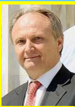
Ο υφυπουργός Αθλητισμού κ. Γιάννης Ανδριανός