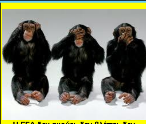
Η ΓΓΑ δεν ακούει, δεν βλέπει, δεν μιλάει! Τότε τι κάνει???