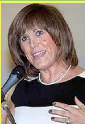
Η γενική γραμματέας Αθλητισμού κα Κυριακή Γιαννακίδου