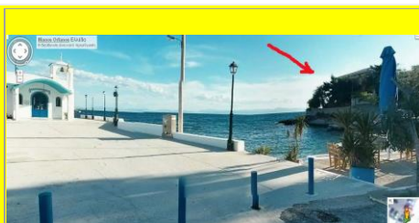
Προσευχή και ...