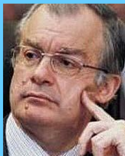
Ο νέος υπουργός Πολιτισμού κ. Κωνίνος Τασούλας

Με το άρθρο " 30/4/2014 - Καταγγελία του ΔΣ/ΕΛΟΚ στη ΓΓΑ με αίτημα έκπτωσής του!!! " αποδεικνύεται ότι έστελνα στη διοίκηση της ΓΓΑ ένα-ένα όλα τα άρθρα μου τα σχετικά με τη διαφθορά και τη διαπλοκή που κυριαρχεί στην ΕΛΟΚ.