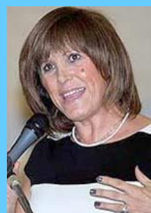
Η γενική γραμματέας Αθλητισμού κα Κυριακή Γιαννακίδου

Οι μεγάλοι Υπεύθυνοι για την Διαφθορά στην ΕΛΟΚ και Προστάτες του μαγαζιού του Γερόλυμπου!!!