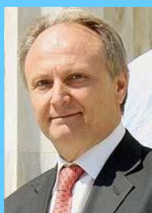
Ο υφυπουργός Αθλητισμού κ. Γιάννης Ανδριανός