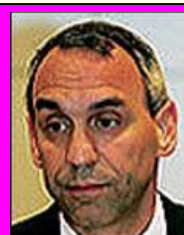
1-Γερόλυμπος "ΕΠΙΤΙΜΟΣ" = "Ο ΑΡΧΙΤΕΚΤΩΝ"

4) Το πρωτάθλημα Γουάντο-ρύου οργανώθηκε από την Οργάνωση Γουάντο-ρύου του Μπουλούμπαση! Σε ποιανού τσέπες πήγαν οι εισπράξεις από τις συμμετοχές των αθλητών? Γιατί να πάνε στις τσέπες του Κοσμίδη? Γιατί να πάνε στις τσέπες του Χονδροματίδη? Γιατί να πάνε στις τσέπες του Πάση? Προφανώς και δεν πάνε στις τσέπες αυτών, αλλά