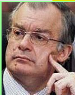
Ο νέος υπουργός Πολιτισμού κ. Κων/νος Τασούλας

Με το άρθρο " 30/4/2014 - Καταγγελία του ΔΣ/ΕΛΟΚ στη ΓΓΑ με αίτημα έκπτωσής του!!! " αποδεικνύεται ότι έστελνα στη διοίκηση της ΑΓΓΑ ένα-ένα όλα τα άρθρα μου τα σχετικά με τη διαφθορά και τη διαπλοκή που κυριαρχεί στην ΕΛΟΚ.