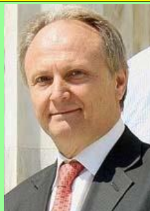
Ο υφυπουργός Αθλητισμού κ. Γιάννης Ανδριανός