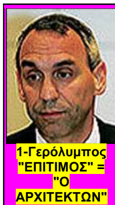
1-Γερόλυμπος "ΕΠΙΤΙΜΟΣ" = "Ο ΑΡΧΙΤΕΚΤΩΝ"

1) Όχι και να μας πείτε ότι ο Μπουλούμπασης έχει την φαιά ουσία να οργανώσει το πρόγραμμα σπουδών μιας τέτοιας σχολής! Ο Γερόλυμπος όμως την έχει! Άρα αυτός διοικεί! Το πόνι υπογράφει! Γι' αυτό είναι ο Γερόλυμπος από το πρωί μέχρι το βράδυ στις αίθουσες της Σχολής παρόλο που έχει τιμωρηθεί από την Παγκόσμια και μαζί του παραμένει η ΕΛΟΚ εκτός Βαλκανικής! Και ρωτώ την ΑΓΓΑ: Τι δουλειά έχει ο Γερόλυμπος να κάνει τις συνεννοήσεις για τη λειτουργία της Σχολής και τι δουλειά έχει στους χώρους της λειτουργίας της Σχολής καθ' όλες τις ώρες λειτουργίας της???