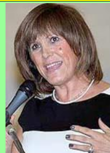
Η γενική γραμματέας Αθλητισμού κα Κυριακή Γιαννακίδου

ΓΓΑ = Ο Οίκος της Μεγάλης ΑΝΟΧΗΣ: 1-ΕΛΕΥΘ/ΠΙΑ 2-Realnews 3-ΚΑΘΗΜΕΡΙΝΗ 4-karate.gr 5-gazzetta 6-zouglia.gr 7-Δίκη/ΣΚΑΙ 8-ΕΛΕΥΘ/ΠΙΑ 9-Δίκη/ΣΚΑΙ