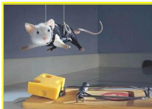
Mission Impossible: Πάτε για το τυρί? Θα σας μαγκώσει η φάκα!

Πώς μπορεί να εμφανίζονται ως "διδάσκοντες εκπαιδευτές προπονητών" στην πρακτική του καράτε, αφού τα έχουν υποτίθεται ξεχάσει? Εκτός αν όλα αυτά τα χρόνια διδάσκουν στη ζούλα καράτε, εισπράττουν μαύρο χρήμα χωρίς να φαίνεται και παραβαίνουν επί μακρόν και την αθλητική και την φορολογική νομοθεσία! Μήπως το ... μπορούδέψατε λιγάκι??? Είσαστε και κόπανοι συν τοις άλλοις, διότι τα άρθρα μου έχουν φτάσει στα γραφεία του ΣΔΟΕ!!! Μη μου πείτε ότι έφταιγα εγώ! Η απληστία σας φταιει!!!