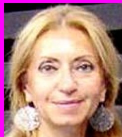
3-Γερολύμπου Αναπλ. Πρόεδρος