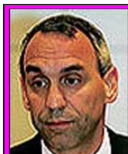
1-Γερόλυμπος "ΕΠΙΤΙΜΟΣ" = "Ο ΑΡΧΙΤΕΚΤΩΝ"

"Αρμεχτή" σημαίνει μπαίνεις μέσα, αράζεις, αρμέγεις τον πρώτο μήνα, αρμέγεις το δεύτερο μήνα, αρμέγεις τον τρίτο μήνα, κ.ο.κ.)