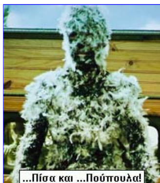
...Πίσσα και ...Πούπουλα!

Βρέμη 4-11-2014: ... Πίσσα και Πούπουλα επιφύλαξαν 102 εθνικές ομοσπονδίες καράτε 102 χωρών στην Ελληνική υποψηφιότητα του Γιώργου Γερόλυμπου για μια θέση στο ΔΣ της Παγκόσμιας του Καράτε! Τον χαρακτήρισαν "Persona non Grata"!!!