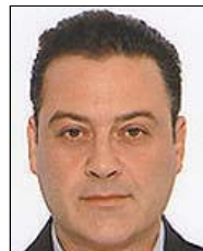
Καρβούνης "Ο Αστυνομικός"