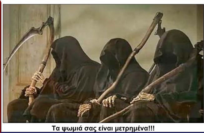
Τα ψωμιά σας είναι μετρημένα!!!

Απόδειξη: Ιδού η επιστολή γλειψίματος της ΕΛΟΚ προς την Βαλκανική και η μετάφρασή της: