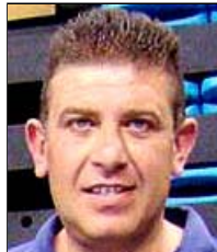
Χονδροματίδης "Ο Ανεγκέφαλος"