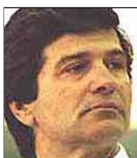
Πάσης "Ο... Ανέραστος"