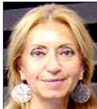
Γερολύμπου "Η... Αναμάρτητη"