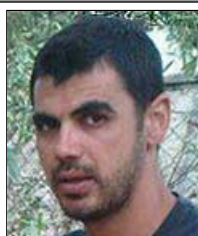
Γκουβούσης "Ο Ανύπαρκτος"