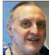
Δημητριάδης "Το Αρπακτικό"