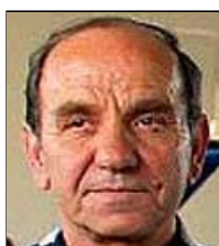
Βόβλας "Ο Ακαπίστρωτος"