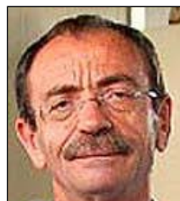
Μπουλούμπασης "Ο Αυτοφωράκις"