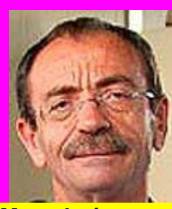
Μπουλούμπασης "Το Ανδρείκελο"