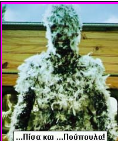
...Πίσσα και ...Πούπουλα!

Οι σκληροπυρηνικοί της Ελληνικής Ομοσπονδίας Καραλαμόγιων και μερικοί συνεργάτες τους!!!