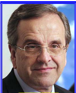
Γνωρίζει ο πρωθυπουργός αυτά που κάνετε εκεί στην αμαρτωλή ΓΓΑ???

Οι νόμοι έχουν καταστήσει "κομματικά εργαλεία", που ευνοούν τους ημέτερους και κατακεραυνώνουν τους αντιφρονούντες! Όποια φιλότιμη προσπάθεια και αν γίνεται από μερικούς υπερκαλύπτεται τελικά από την επάρατη νόσο του "Συνδρόμου του Γερόλυμπου"!