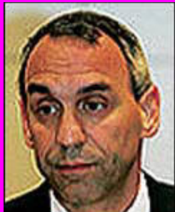
Γερόλυμπος "Ο Δικτάτορας"

3 - Τις Παρανομίες κατά τη λειτουργία της Σχολής, κατά την οποία λειτουργία η φασιστική συμμορία της ΕΛΟΚ ξάφριζε τους υποψήφιους προπονητές αποδεκατίζοντας τους εχθρούς της!