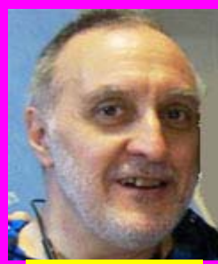
Δημητριάδης "Το Αρπακτικό"

Τα σκληροπυρηνικά στελέχη της ΕΛΟΚ και της Νέας Δημοκρατίας, που έχουν μετατρέψει την Ομοσπονδία Καράτε σε προσωπική τους επιχείρηση!